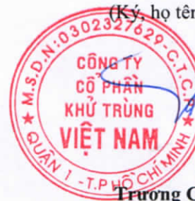
Trương Công Cứ