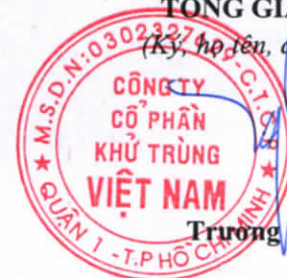
Trương Công Cứ